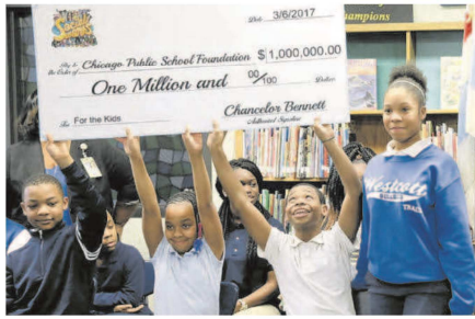
In einer Grundschule der Stadt Chicago überreichte der Musiker Schulkindern den Scheck.