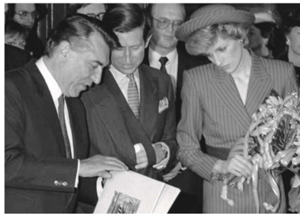
Prinz Charles war zuletzt mit Prinzessin Diana im Jahr 1986 auf Staatsbesuch in Wien.