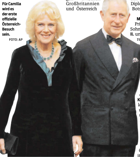
Für Camilla wird es der erste offizielle Österreich-Besuch sein.

Das Programm reichte von Treffen mit Bundespräsident Rudolf Kirchschläger , Bundeskanzler Fred Sinowatz und Bürgermeister Helmut Zilk über kulturelle Ereignisse bis zu einer Fahrt des Prinzenpaares mit dem Fiaker in der Wiener Innenstadt. Für Camilla werde es die erste offizielle Visite in Österreich sein, hieß es in der Aussendung.